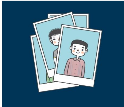
2. Одна фотография в формате для паспорта