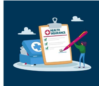
3. Оригинал договора о медицинском страховании (настоятельно рекомендуем студентам сделать копии страхового договора и карты)